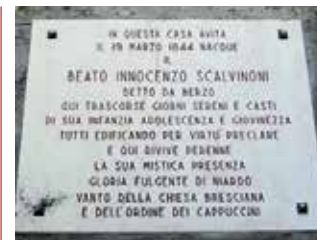
Niardo: La targa ricorda la casa in cui nacque il Frate cappuccino.

La fiaccolata, a cui ha preso parte anche un consistente numero di fedeli proveniente da Sovere in provincia di Bergamo, ha fatto da prologo alla festa patronale dedicata al Beato Innocenzo svoltasi domenica 3 marzo. Gli orari di partenza dei gruppi è stata diversificata in rapporto alla distanza e, dopo una sosta all'ospedale di Esine si è giunti a Berzo Inferiore sul cui piazzale tutti i partecipanti hanno sostato in preghiera davanti alle reliquie del Beato, il corteo è proseguito verso il santuario dove p. Pietro Bolchi ha impartito la benedizione e i fedeli hanno potuto sostare davanti all'urna del Beato.