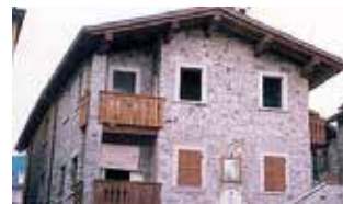
La casa in cui Beato Innocenzo visse durante la sua permanenza a Berzo Inferiore.

La devozione per il Beato Innocenzo da Berzo è molto sentita in Valle Camonica e non solo. Lo ha ancora una volta testato la dodicesima fiaccolata comprensoriale promossa dalla parrocchia di Santa Maria Nascente e dall'oratorio di Berzo Inferiore e che si è svolta la sera di sabato 24 febbraio scorso. Attraverso diversi itinerari, i cortei di fedeli del "fratassi" hanno raggiunto Berzo Inferiore, per ricordare il 128esimo anniversario della morte di Innocenzo Scalvinoni, nato a Niardo il 19 marzo 1844. Una lapide sulla casa natale ricorda oggi la nascita di quel bimbo, divenuto "esempio sublimato per eroismo di virtù".