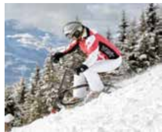
Un modello di snowbike.

• Anche in Valcamonica si va affermando sulle piste di Pontedilegno, del Tonale e di Temù, dell'Aprica, di Montecampione e della Val Palot lo snowbike , sport d'origine austriaca, che ha cominciato a diffondersi alla fine degli anni Quaranta. Per praticarlo servono delle biciclette da neve, con le lamine degli sci (doppie o singole) al posto delle ruote. Promotrice di questo sport in Valle è la Gmg con sede a Darfo e costituita tre anni fa da un gruppo di amici appassionati di snowbike che si sono assunti anche il compito di guidare gli interessati all'apprendimento tecnico e sportivo della snowbike.