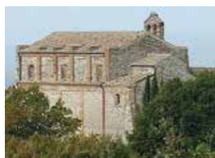
Calvi d'Umbria: il monastero.