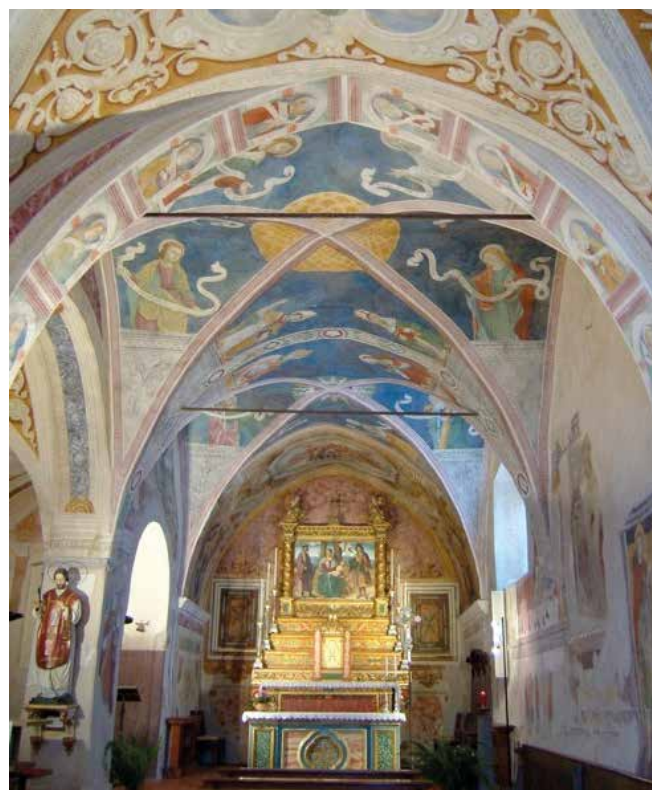
Breno: L'interno del quattrocentesco santuario dedicato a San Valentino.