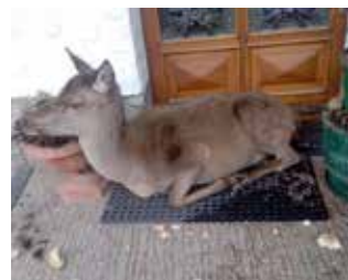
Un cervo davanti a una casa.

• Le abbondanti neviccate dello scorso febbraio, tanto attese da operatori turistici e amanti della montagna, hanno creato qualche problema a chi in montagna ha il suo habitat naturale: come i cervi. In particolare a Pezzo e Prescasaglio , frazioni del comune di Ponte di Legno, questi animali per nutrirsi si avvicinano alle case. Per soddisfare tali loro primarie necessità i cittadini hanno raccolto gli scarti di frutta e verdura dai negozianti per poterli poi donare ai loro amici selvatici, che, come si vede dalla foto, hanno molto gradito.