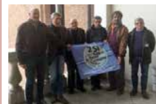
I rappresentanti del Comitato.

trà essere fissata nell’arco di tempo che va dal 30 aprile a fine giugno.