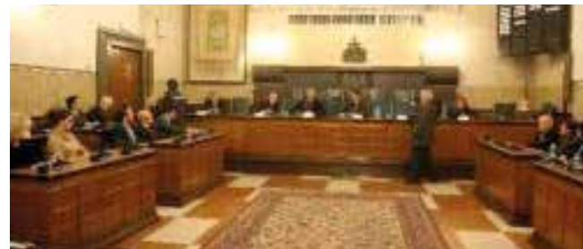
Brescia: Nella Sala Consigliare del Broletto l’incontro del Vescovo di Brescia con gli amministratori.

Ampio e articolato il susseguirsi degli interventi che hanno riguardato l’uso dei nuovi strumenti di comunicazione, l’utilizzo e la funzione degli oratori, l’accostamento dei giovani alla politica e il ruolo importante della formazione scolastica.