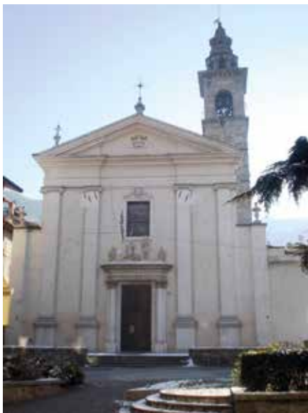
Darfo B.T.: La chiesa dei Santi Patroni Faustino e Giovita.