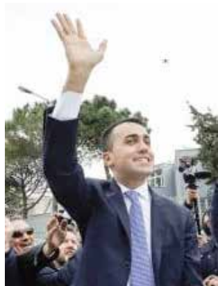
Luigi Di Maio.

Hanno invece vinto senza incertezze di sorta il Movimento 5 Stelle e, nella coalizione del centro destra, la Lega di Salvini. Se Luigi Di Maio col 32,66% del suo partito ritiene che tocchi a lui il compito di ricercare una maggioranza di governo che l'esito elettorale non ha assegnato a partiti o coalizioni, Matteo Salvi-