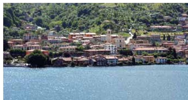
Uno scorcio del paesaggio di Sulzano.