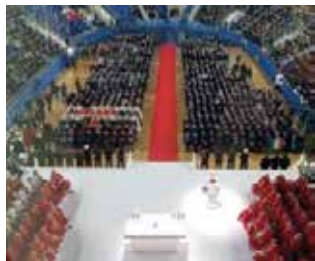
Vigevano: Il Palasport gremito di fedeli.

■ Teresio Olivelli ha raggiunto l'onore degli altari e sarà ricordato il 16 gennaio, giorno del suo Battesimo. La solenne cerimonia presieduta dal cardinale Angelo Amato, prefetto della Congregazione delle cause dei santi, si è tenuta a Vigevano, città in cui Teresio è cresciuto, nel palazzetto dello sport gremito in ogni posto. Qui il cardinale Amato ha dato lettura della Lettera apostolica con cui papa Francesco ha iscritto nell'Albo dei beati il "laico martire" ucciso dai nazisti nel campo di concentramento tedesco di Herbruck dove ha dato la testimonianza suprema difendendo "i deboli e gli oppressi fino al dono della vita". Tra gli oltre 4.000 fedeli presenti tantissime le penne nere degli alpini, particolarmente toccate dallo scoprimento dell'immagine di Olivelli con cappello da alpino. Con il cardinale, oltre ad un centinaio di sacerdoti, hanno concele-