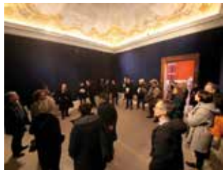
Brescia: La sala blu della Pinacoteca durante la presentazione alla stampa e alle autorità cittadine. Accoglierà alcune opere del Moretto.