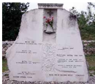
Il cippo a ricordo della foiba di Basovizza.

La cerimonia del Giorno del Ricordo è stata diffu-