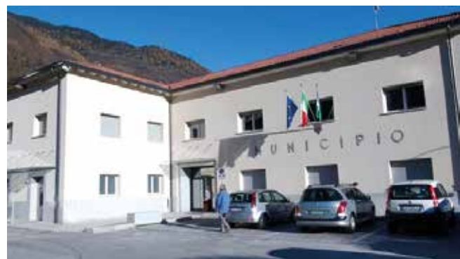
Malonno: Il Municipio.

stema consentiva a tutti i soggetti coinvolti nell'inchiesta, di avere, in forme diverse, un profitto a spese della collettività. Queste le opere pubbliche del Comune di Malonno sotto inchiesta: illuminazione pubblica, rifacimento dei marciapiedi e delle opere sulla biblioteca. A condurre le indagini i Carabinieri di Edolo e Breno.