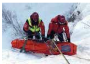
Volontari del Soccorso Alpino in esercitazione.

• Approfittando delle condizioni climatiche che nelle zone montane attraggono ancora tanti appassionati degli sport invernali, si è svolta nella zona una impegnativa esercitazione dei tecnici della quinta Delegazione bresciana del Corpo nazionale Soccorso alpino e speleologico. I soccorritori hanno appunto simulato un intervento di recupero su una cascata di ghiaccio dall'elevato contenuto tecnico preparato, nella parte teorica pre-