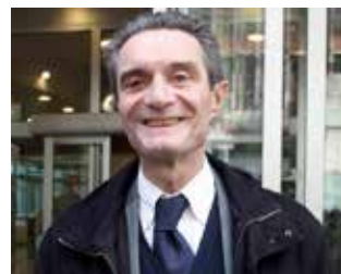
Attilio Fontana è il nuovo presidente della Regione Lombardia.

■ I sondaggi davano favorito il centro destra e quindi Attilio Fontana presidente della Regione Lombardia, ma non era lontanamente immaginabile che lo scarto col candidato del PD Giorgio Gori fosse così netto. I dati definitivi attribuiscono al centro destra il 49,74% dei voti, mentre il centro sinistra si attesta ad appena il 29,09% e il Movimento 5 Stelle al 17,36%. Certamente la divisione all'interno dell'area di centro sinistra ha influito sul risultato, ma tenuto conto della inimmaginabile differenza, anche se ci fosse stato un accordo, un tale gap non si sa-