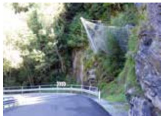
Cevo: Un tratto della Sp. 84.

La provinciale della Valsaviore che attraversa il Comune di Cevo è interessata da sempre da periodiche cadute di sassi e materiale dal versante Nord, e nel dicembre del 2009 si era verificato un distacco più importante degli altri che l'aveva interrotta. Per contenere tali disagi erano stati avviati importanti interventi di pulizia del versante roccioso a cui era