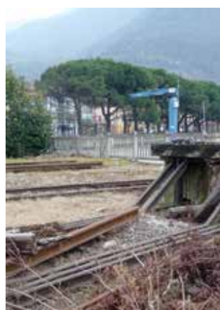
Pisogne: L'area da destinare a parcheggio.

sibilità di parcheggio per gli utenti che utilizzano il servizio ferroviario.